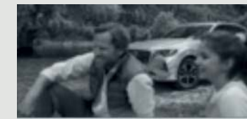
IN VERBINDUNG BLEIBEN