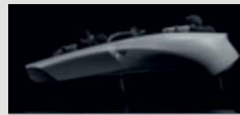
HANDWERKSQUALITÄT AUS JAPAN