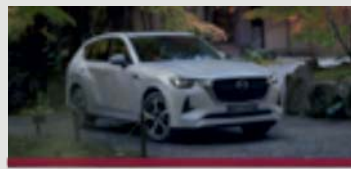
DER BRANDNEUE MAZDA CX-60