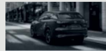
LEIDENSCHAFT FÜR DAS FAHREN