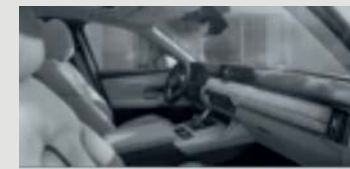
IHR MAZDA CX-60