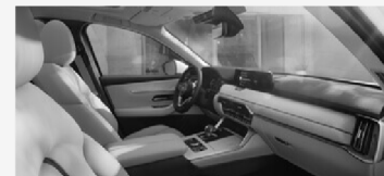
TU NUEVO MAZDA CX-60