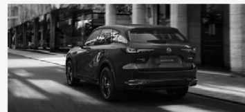
PASIÓN POR LA CONDUCCIÓN