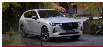
NUEVO MAZDA CX-60