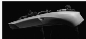
CRAFTED IN JAPAN